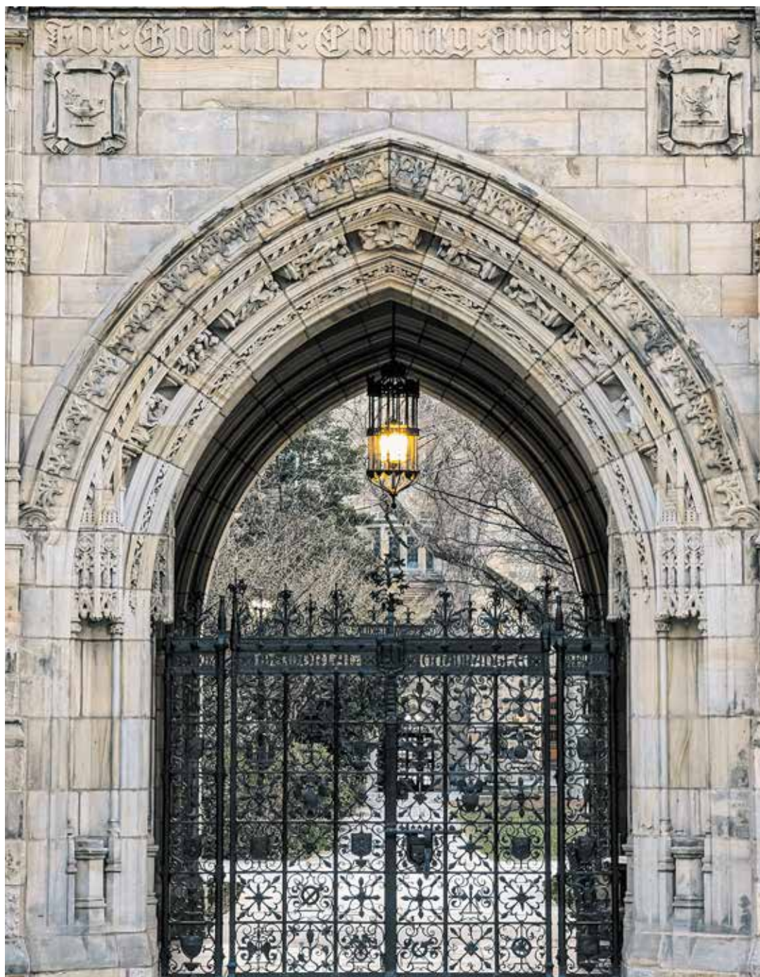
Poort naar Yale-gebouw