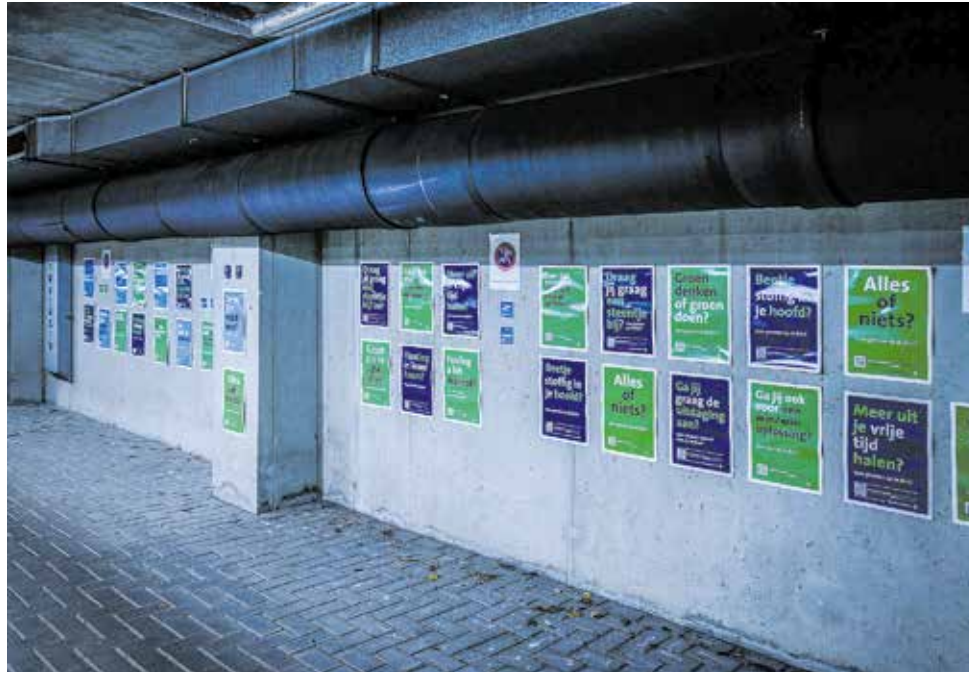
De posters die medewerkers moeten aanmoedigen om vakantiedagen op te nemen

Het lijkt voor de ondersteunende staf iets